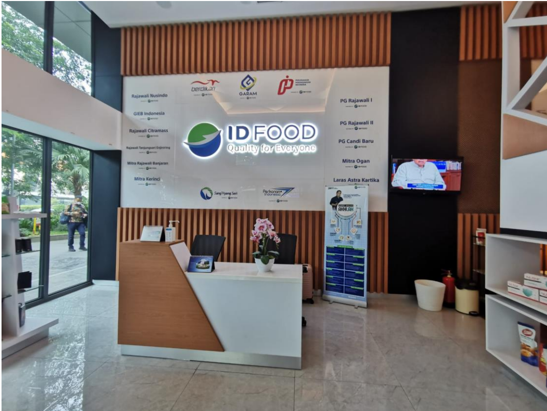
Gambar 1 Lounge ID FOOD yang berada di lantai GF

Fasilitas komunikasi serta meja dan kursi layanan, serta memperhatikan protokol kesehatan yang ketat termasuk mengatur kembali ruang layanan. Pengajuan permohonan melalui email corcomm@idfood.co.id , pemohon informasi juga dapat menghubungi PPID Holding Pangan ID FOOD pada nomor Telp. 021-80604255 atau Fax. 021-80604266, juga dapat melalui tatap muka dengan langsung datang menuju ruang layanan informasi publik PPID Holding Pangan ID FOOD.